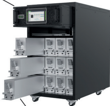
Gabinete metálico para baterías (opcional)