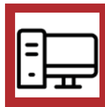
Salas de Cómputo-ISP