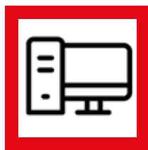
Centros de Cómputo